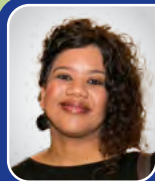
Me. Z. Siwa (DH: ADFIN/HFB)